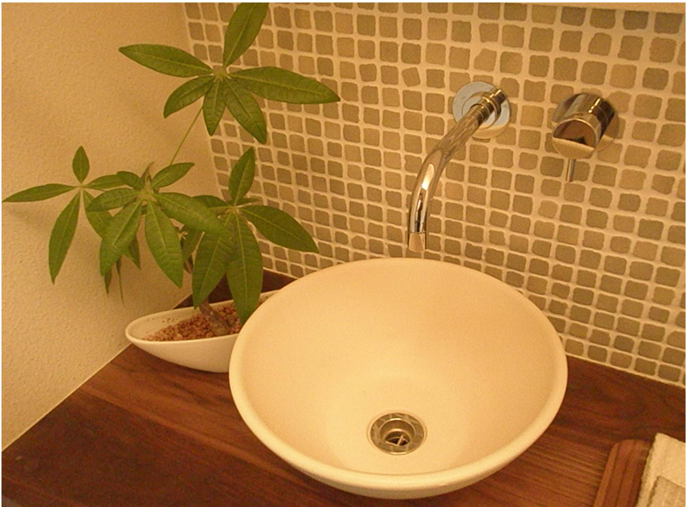
商品名:アルターナ(25角) TN-25/AT-2