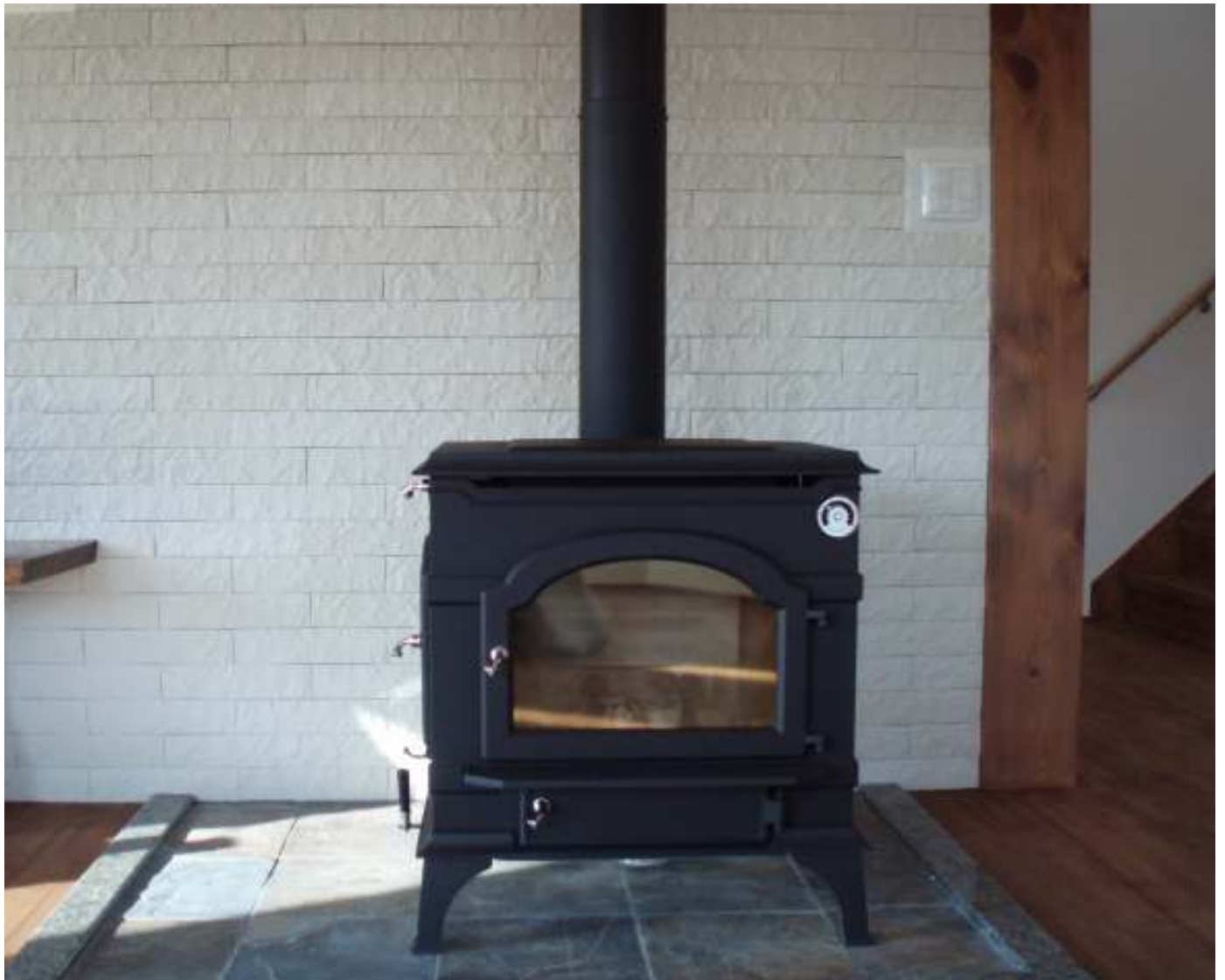
商品名:バルーンストーン OW(オフホワイト)